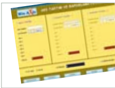
WinAxle Aks Tartım ve Raporlama Programı