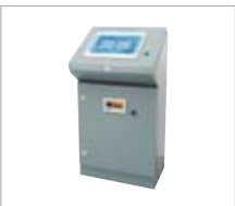
Dokunmatik Tartı Terminali