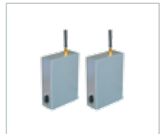
RF Haberleşme Kiti