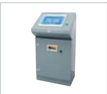
Dokunmatik Tartı Terminali